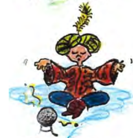
1994 - 1001Nacht