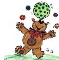
1993 + 2013 Zirkus

„Eine Zeitreise durch 25 Jahre Camp der Fantasie“