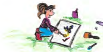
2009 - Wunder