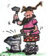
1996 Mittelalterlicher Jahrmarkt