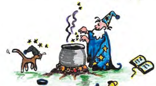
2005 - Märchen