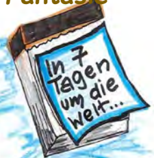
2012 - In sieben Tagen um die Welt